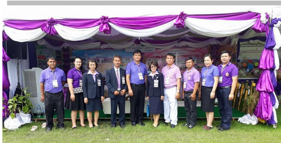
งานวิเคราะห์นโยบายและแผน องค์การบริหารส่วนตำบลกี้ดช้าง อำเภอแม่แตง จังหวัดเชียงใหม่