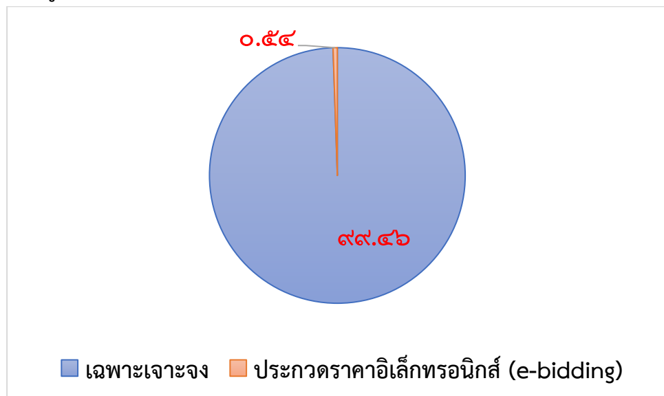
แผนภูมิแสดงร้อยละของจำนวนโครงการจำแนกตามวิธีการจัดซื้อจัดจ้าง ดังนี้